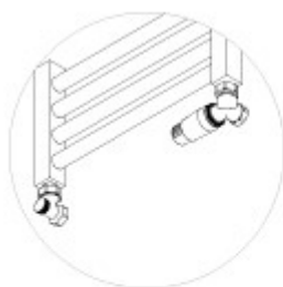
zawór termostatyczny mini trójosiowy prawy

Zestaw termostatyczny trójosiowy w figurze lewej lub prawej